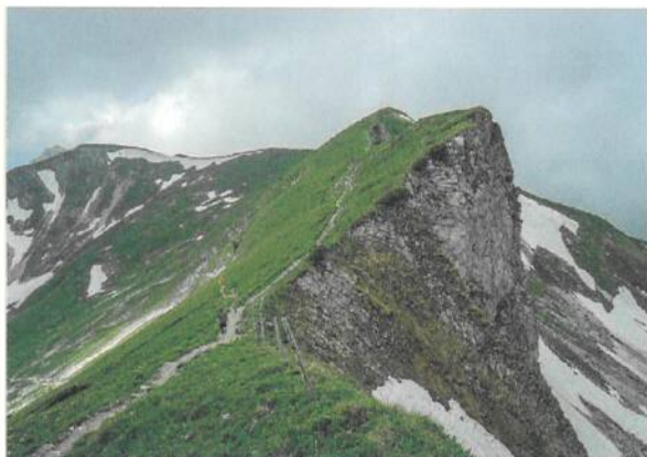
Coup d'œil en arrière sur la crête du Moléson.

Fromagerie d'Alpage, Moléson-sur-Gruyères, 026 921 10 44, www.fromagerie-alpage.ch