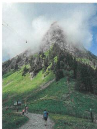
De Plan-Francey, le Moléson a l'air encore un peu inaccessible.